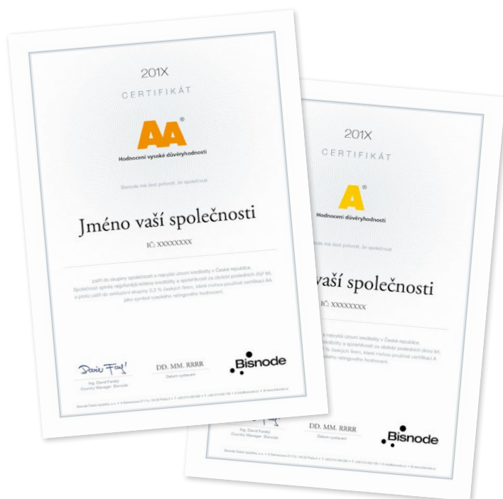
Mezinárodní ocenění AA a A Náhled tištěného certifikátu